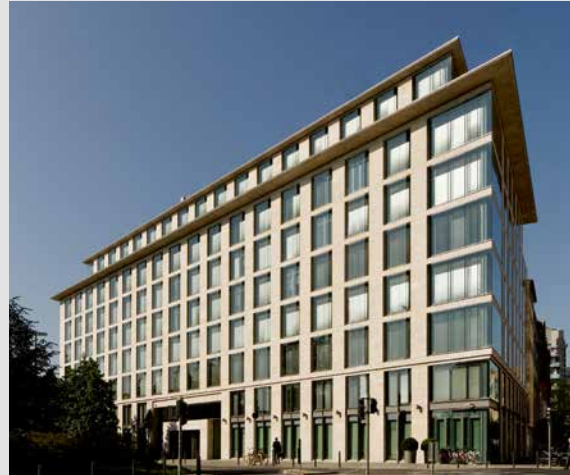
Metzler-Hauptgeschäftssitz Untermainanlage 1, Frankfurt am Main

Größere Zinsvorteile können am Markt für Specials erzielt werden, in dem ganz bestimmte Wertpapiere beispielsweise zur Deckung von Short-Positionen oder zur Arbitrage gesucht werden.